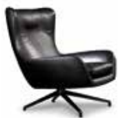
3-4 JENSEN BERGÈRE CM 81X97 H94 POUF CM 62X66 H40