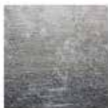
9 DIBBETS RAINBOW "ARCTIC" TAPIS CM 400X400